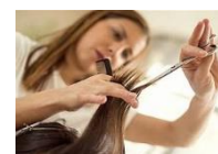
Schéma de la filière des métiers de la coiffure en 2019 – Diplômes de l'éducation nationale

Insertion directement dans la vie active