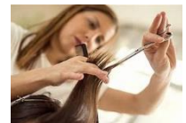
Schéma de la filière des métiers de la coiffure en 2019 – Diplômes de l'éducation nationale

Insertion directement dans la vie active